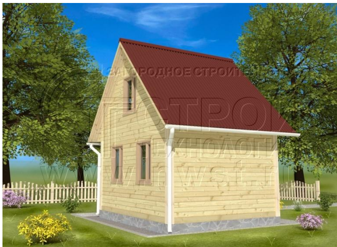
Внешний вид дома